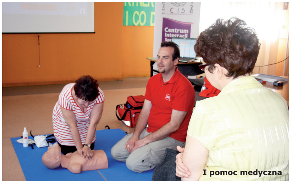
I pomoc medyczna

społecznym (Miejski Ośrodek Pomocy Rodzinie w Chełmie, Sąd Rejonowy – Wydział Rodzinny i Nieletnich, Wydział Karny, Oddział Terapii Uzależnień w Chełmie, Powiatowy Urząd Pracy oraz przedsiębiorcy chełmscy).